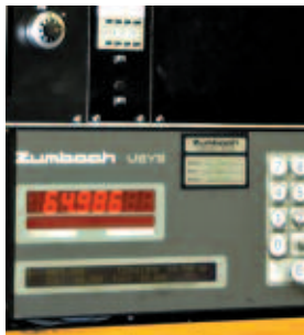
CONTROL POR RAYO LÁSER