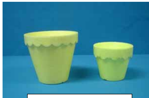
MACETA 6 Y MACETA 4